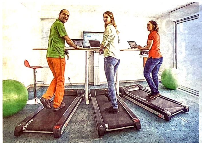
Les « walking desks » d'ActivUp continuent à se vendre comme des petits pains.